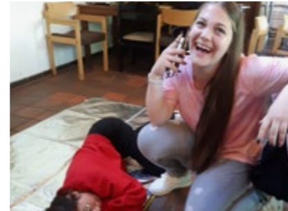
Immer was los beim Kreisjugendwerk: Beim Ausflug in den Heidepark hatten alle viel Spaß; ebenso beim lehrreichen Erste-Hilfe-Kurs.