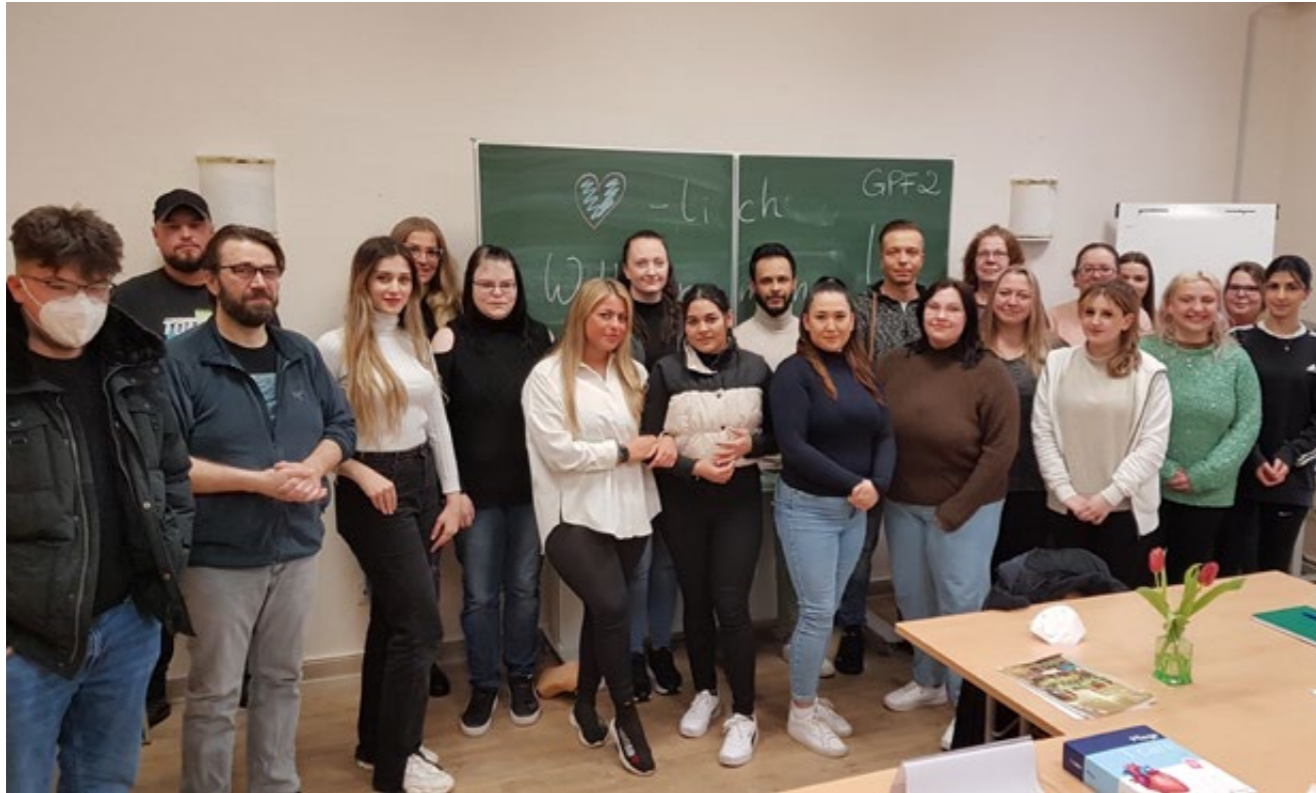
Sind in einen spannenden und so dringend benötigten Beruf gestartet: die 22 angehenden Pflegefachleute in der Ursula-Kaltenstein-Akademie der AWO Bremerhaven.